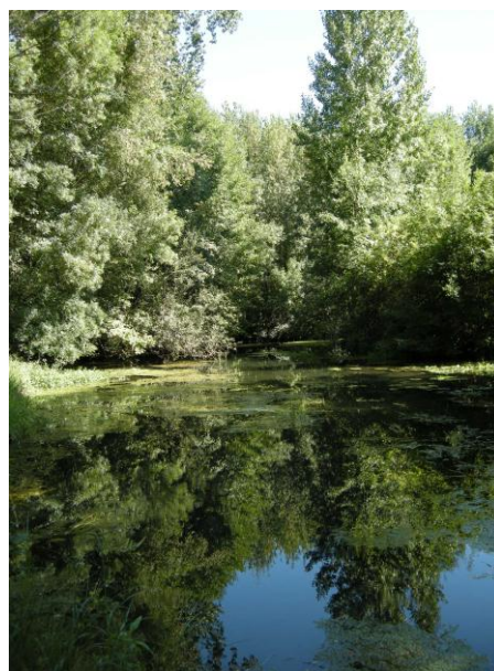
La Seugne, source : CG 17

L'intérêt majeur du site réside par la présence continue d'une population de Vison d'Europe, espèce d'intérêt communautaire prioritaire, en voie de disparition en Europe occidentale. Le bassin de la Seugne abrite l'un des derniers noyaux de population de cette espèce en Europe. C'est principalement pour cette raison que le site a été proposé à la Commission Européenne par la France comme Site d'Intérêt Communautaire. Le site abrite également des habitats caractéristiques de vallées en plaine atlantique dont certains sont d'intérêt communautaire : forêts alluviales, friches humides, végétation immergée des rivières. On y trouve également des espèces d'intérêt communautaire tel que la Rosalie des Alpes (espèce prioritaire), la Loutre d'Europe, la Cistude d'Europe, et de nombreux chiroptères.